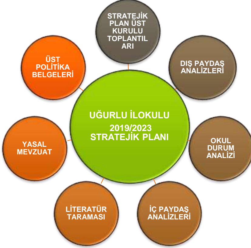
Şekil 1: Stratejik Plan Hazırlık Çalışmaları